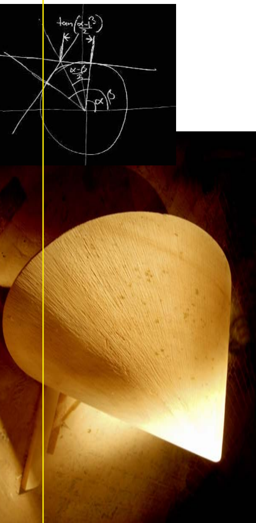
Abb. oben: Oloid in Farbpigment Abb. mitte: Aus Sandstein gefertigter Oloid Grafik: Stephan von Borstel, Kassel - www.svborstel.de